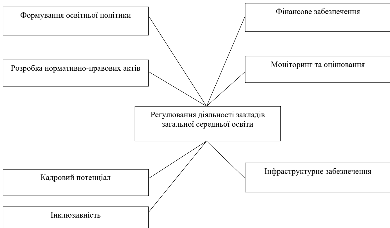
Рис. 1. Регулювання діяльності закладів загальної середньої освіти

Основні аспекти процесу регулювання діяльності закладів загальної середньої освіти включають декілька обов'язкових складових, що представлено на рис. 1.