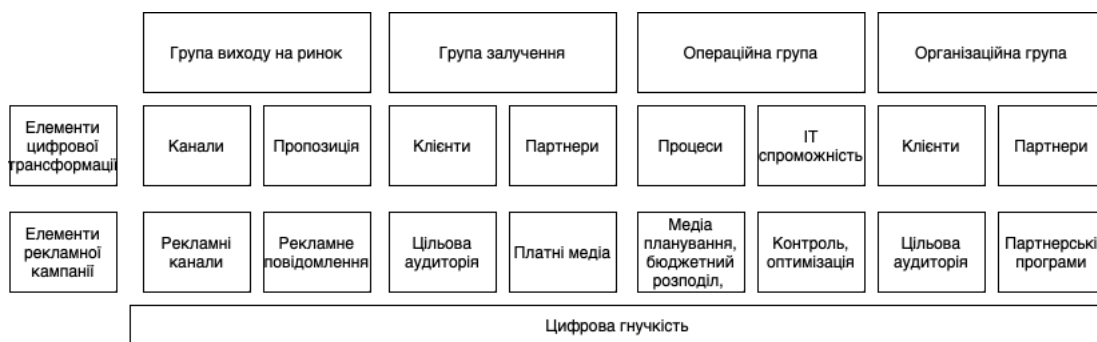
Рис. 1. Схема зв'язку цифрової трансформації та рекламної кампанії

Ще один підхід до визначення вимірів цифрової трансформації виділяє чотири групи: організаційну, операційну, залучення та виходу на ринок і додатковий елемент цифрової гнучкості, який є інтегруючим [16]. Зобразимо на рисунку Схема застосування цього підходу до рекламної кампанії представлена на рисунку 1.