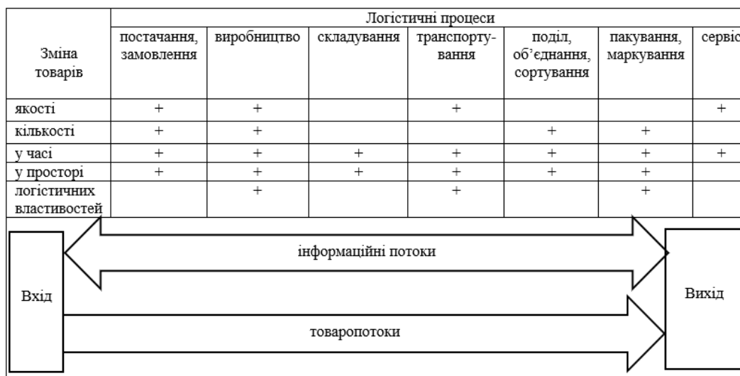
Рис. 1. Логістична система трансформації товарів з урахуванням логістичних процесів організації

Під час функціонування вантажопотоків операції інформаційної і матеріальної підсистем циркулюють паралельно та взаємодіють одна з одною. Адже, завжди матеріальні процеси супроводжуються переробкою інформації, а саме: транспортування, складування і перевантаження вантажів (оформлення транспортних документів і облік руху вантажів тощо). Логістична система трансформації товарів з урахуванням логістичних процесів організації представлена на рис. 1.