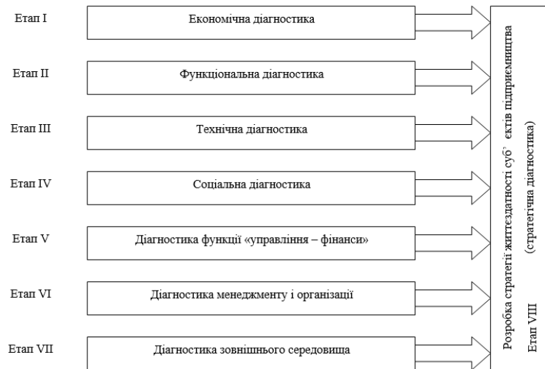
Рис. 2. Послідовність стратегічної діагностики стану суб'єктів підприємництва за Ж. Тібо

показниками розвитку цього сектору економіки, тобто не передбачає подання якісних аспектів функціонування чи перешкод розвитку, а також абсолютно не стосується оцінювання безпекових параметрів.