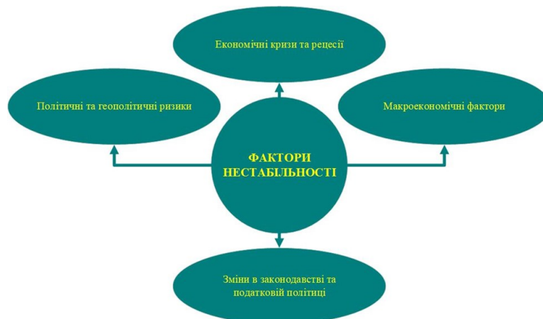
Рис. 1. Ключові фактори нестабільності економічного середовища

Аналіз нестабільного економічного середовища допомагає підприємствам зрозуміти ризики та можливості, що виникають в умовах нестабільності. Він допомагає виявити слабкі місця та прийняти заходи для забезпечення фінансової стійкості, такі як диверсифікація джерел доходів, захист від коливань валютних курсів, адаптація до змін у правових умовах та впровадження ефективного управління ризиками [6]. Це дозволяє підприємствам ефективніше працювати в умовах нестабільного економічного середовища та досягати успіху в найскладніших умовах.