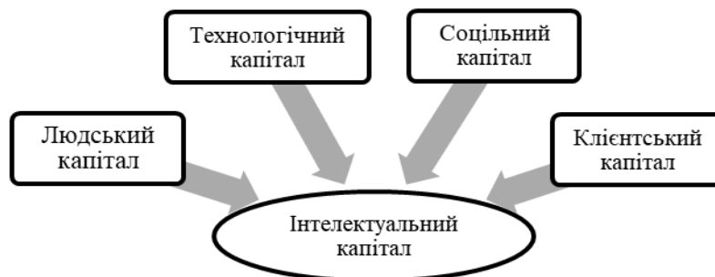
Рис. 3. Загальна структура інтелектуального капіталу

Вищезазначені елементи інтелектуального капіталу схематично показано на рис. 3.