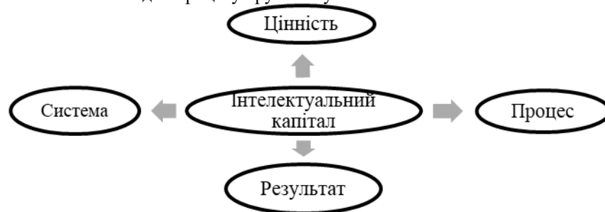
Рис. 1. Економічні аспекти дослідження інтелектуального капіталу

Вважаємо за доцільне звернути увагу на основних економічних аспектах інтелектуального капіталу (рис. 1). Так, інтелектуальний капітал виступає системою, що складається з сукупності взаємопов'язаних елементів. Також він є цінністю – активом, що приносить дохід. Крім цього, інтелектуальний капітал розглядається як процес відтворювальних характеристик, пов'язаних з кругообігом, та результат, тобто приріст у процесі споживання і наслідок процесу кругообігу.