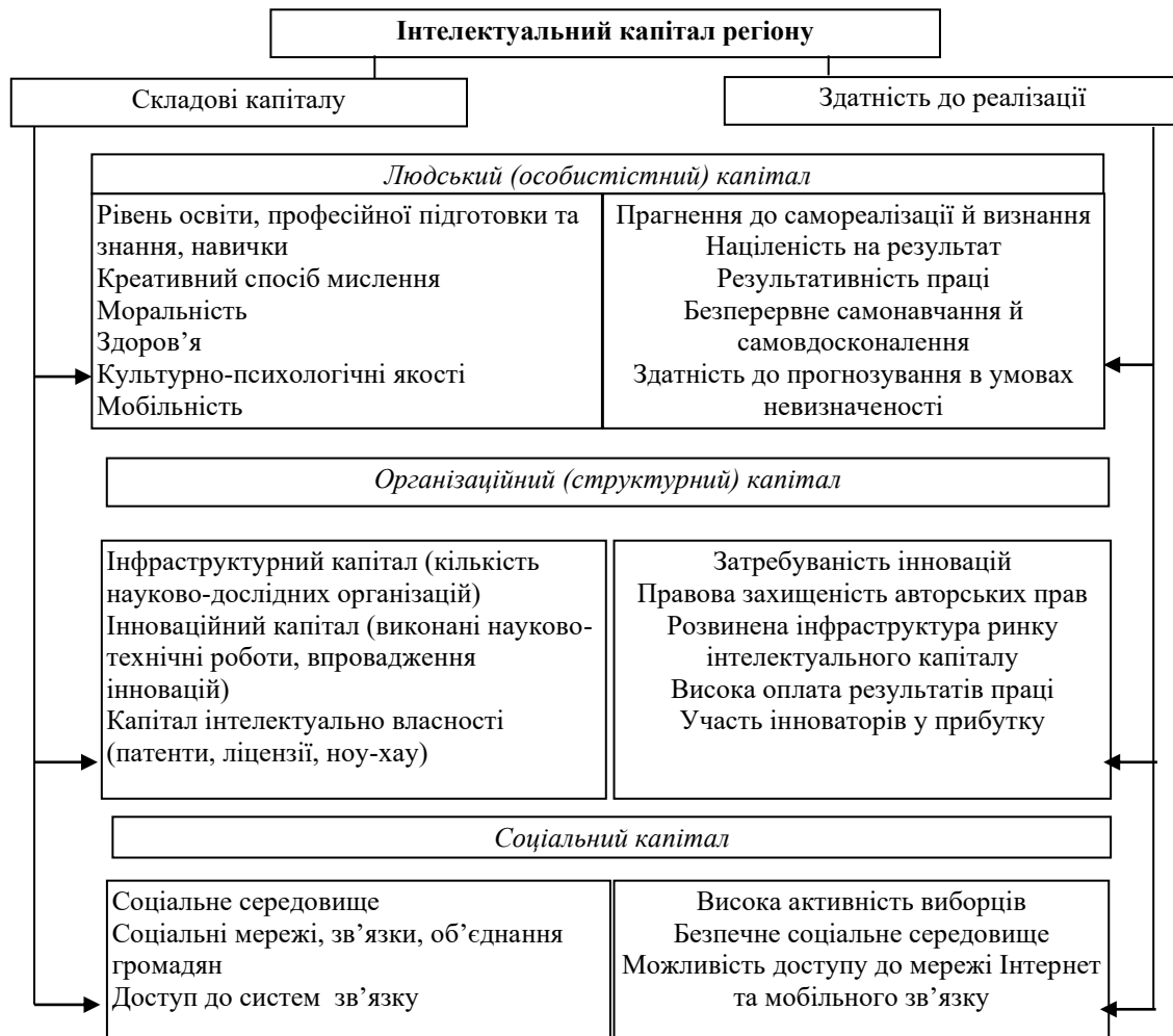
Рис. 4. Структура інтелектуального капіталу регіону

Розглянувши різні думки науковців [16, с. 20; 17, с. 93] щодо складових інтелектуального капіталу, пропонуємо з погляду розвитку інтелектуального капіталу на рівні регіону його структуру представити у такій формі (рис. 4):