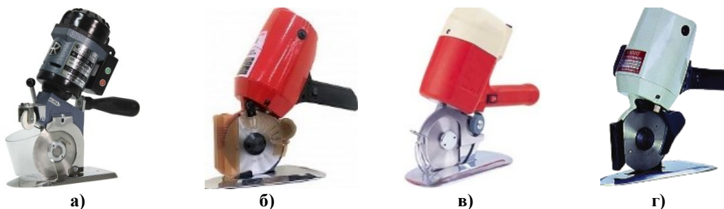
Рис. 2. Пересувні розкрійні машини із дисковим ножом: а) HOFFMAN HF-125; б) MAYER MR-100; в) KNITISM KM RS-100; г) KAIGU YC25-MII

Відомими виробниками розкрійних машин з дисковим ножом є фірми ALL STAR, ANYSEW, BAOYU, BRUCE,CHEERING, DAYANG, FHL, HOFFMAN, JACK, JUCK, KAISIMAN,KAIXUAN, KAIGU, KANGLITE, KNITISM (Японія), KURIS, LEJIANG, MAYER, MAREEW, MINERVA, MEGATEX, TEXI, TIANHONG, TYPICAL, TYPE SPECIAL, PHILPS, RASOR (Італія), SANTIAN,SU LEE, SNYTER, SHUNFA, SPARK SPECIAL, ZOJE, WEIJE, WELMAC, WORLDEN [3-12]. Технічні характеристики дискових ножів відомих світових виробників наведені у табл. 3, їх вартісна характеристика наведені в табл. 4.