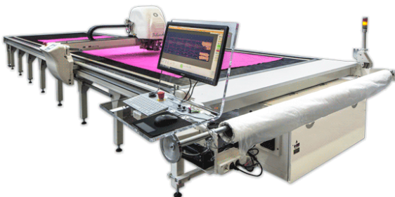
Рис. 5. Автоматичний розкрійний комплекс F.K. Group Biliardo 25-60-80 (Італія) стаціонарного типу з вакуумною установкою

Для позиціонування настилу на розкрійному столі та його ущільнення зазвичай використовується вакуум-відсмоктувач. Готовий настил накривають поліетиленовою плівкою, вмикають вакуум-відсмоктувач, що створює розрідження повітря і щільно притискає шари матеріалу один до одного, забезпечуючи високу точність крою. На плівці може бути нанесена розкладка лекал для контролю оператором процесу розкрою [19].