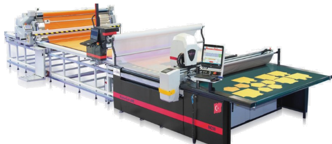
Рис. 6. Автоматичний розкрійний комплекс конвеєрного типу Serkon Makina MC 90 (Польща) з вакуумною установкою

Зазвичай сучасні АРК володіють інтелектуальною системою вибору оптимального шляху різання і управління тиску вакууму; систему вентиляторів; системи автоматичного змащування і заточування ножа; систему моніторингу зношення леза з автоматичним попередженням про необхідну його заміну; пристрій для розмотування полімерної плівки; вбудовані серводвигуни, а також програмне забезпечення з інструкціями на 3-5 мовах, що в комплексі, забезпечує виробництво високоякісного крою.