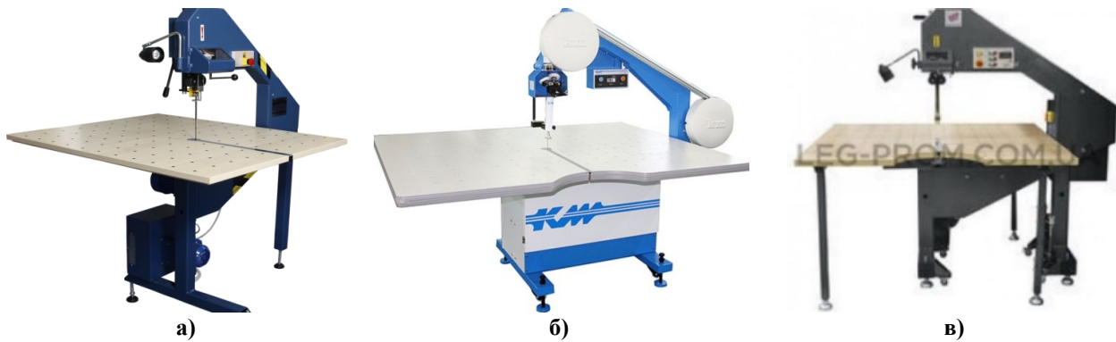
Рис. 4. Стационарні стрічкові розкрійні машини: а) HOFFMAN HF-200 T/500/1; б) KNITISM KB KBK-900S; в) REXEL R1000

продуктивність праці та забезпечують більшу чистоту зрізів деталей. Невелика ширина ножа забезпечує високу маневреність машини під час вирізування деталей будь-яких контурів [2, 5, 18].