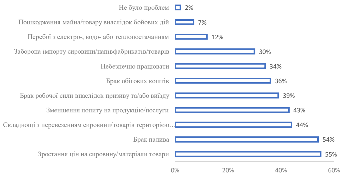
Рис.2. Основні проблеми з якими стикнувся бізнес від початку повномасштабного вторгнення (розроблено авторами за джерелом [4])

У Харкові умови ведення бізнесу вже другий рік поспіль оцінюють як найгірші (1,62 бала). 94% компаній відзначили великі труднощі та лише 6% вважають умови задовільними. Основні проблеми включають зниження купівельної спроможності населення, відтік персоналу за кордон і мобілізацію працівників [8].