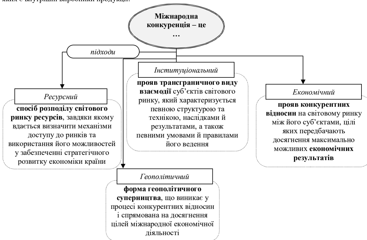
Рис. 1. Теоретичні підходи до визначення сутності поняття «міжнародна конкуренція» з врахуванням аспектів стратегічного розвитку економіки країни

форму суперництва суб'єктів світового ринку, що виникає у процесі їх трансграничної взаємодії і спрямована на досягнення цілей їх зовнішньоекономічної діяльності. Такі характеристики засвідчують залежність стратегічного розвитку економіки від трансграничної взаємодії суб'єктів світового ринку серед яких є внутрішні виробники продукції.