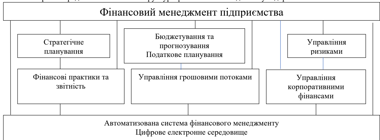
Рис. 1. Загальна структура фінансового менеджменту

На рис. 1 представлена загальна структура фінансового менеджменту підприємства.