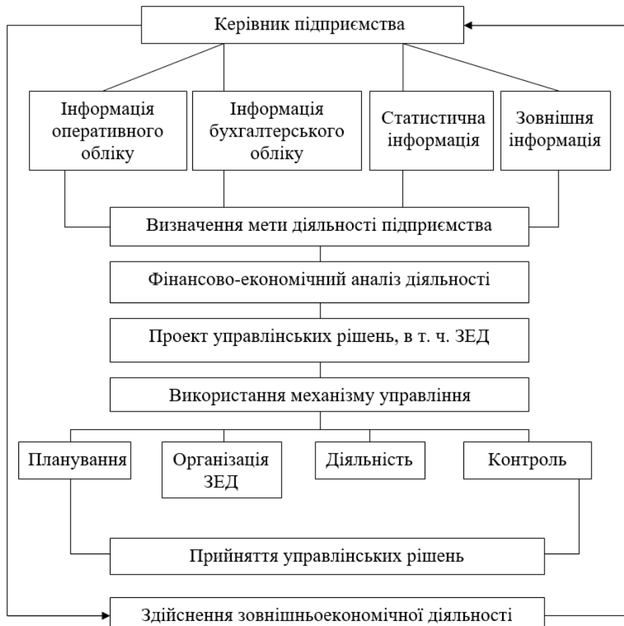
Рис. 2. Оцінка діяльності механізму управління підприємством

Якщо зовнішньоекономічна діяльність підприємств є невід'ємною частиною його господарської діяльності, то механізм управління діяльністю, його комплексний показник ефективності управління – це платіжний баланс. Відповідно, механізм управління зовнішньоекономічною діяльністю підприємства потребує вдосконалення всього механізму діяльності в цілому. Таке управління і складає організаційно-економічний механізм підприємства, рис. 2.