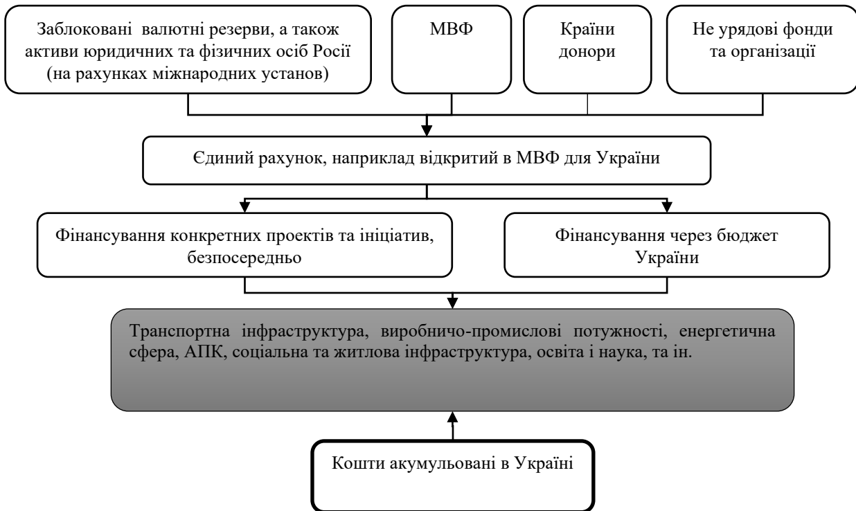
Рис. 3. Механізм фінансового забезпечення плану з відновлення економіки України

Взаємовигода. Реальне стимулювання приватного інвестування (гарантії, вигоди, преференції), з метою створення робочих місць та розвитку внутрішнього споживання, адже нарощування роздрібного товарообігу дасть додатковий поштовх для економіки. Необхідно створити умови максимального сприяння внутрішніх інвестицій. Динаміка внутрішніх інвестицій буде індикатором для прийняття рішень щодо реалізації інвестиційних проєктів іноземними інвесторами.