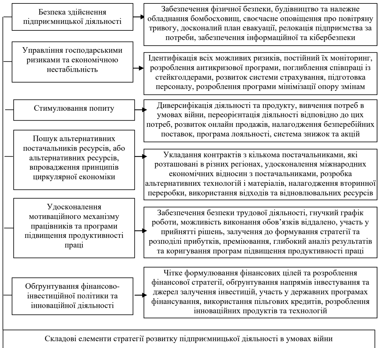
Рис. 3. Стратегія розвитку підприємницької діяльності в умовах війни